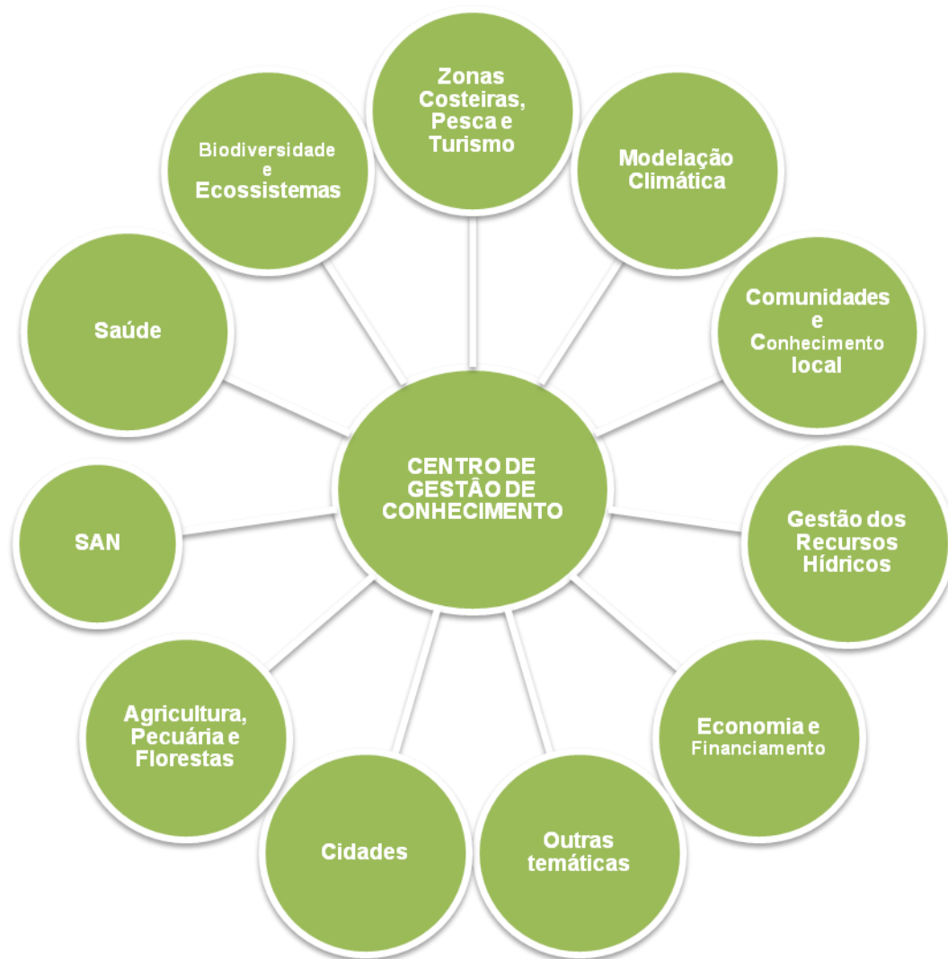
Figura 4 – Estrutura da Rede de Mudanças Climáticas

As necessidades de geração de conhecimento e de capacitação deverão ser determinadas anualmente com base em contributos que se materializam em identificação de barreiras e lacunas pelos agentes da implementação que as comunicam no GIIMC que as relata à UMC. As necessidades que sejam classificadas como prioritárias são a base para a definição dos planos anuais de actividades do CGC. A UMC pode também solicitar ao CGC assessoria técnica e científica.